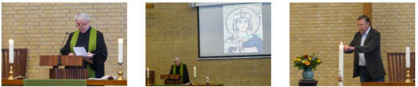
Dienst met ds Nieuwenhuizen.