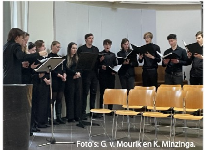
Impressie van de gezamenlijke dienst op 9 februari 2025 in de Lucaskerk.