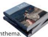
Annerieke van Vianen

Samen kunnen we hopelijk bijdragen aan een groter bewustzijn en meer begrip rondom het vluchtelingentema.